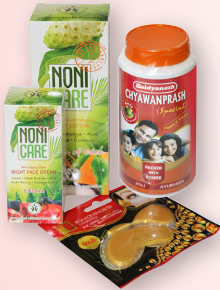
«Секреты красоты»: Маски для кожи век, крема серии «NonaCare», кокосовое масло, эликсиры «Лаоли» или «Чьяванпраш»