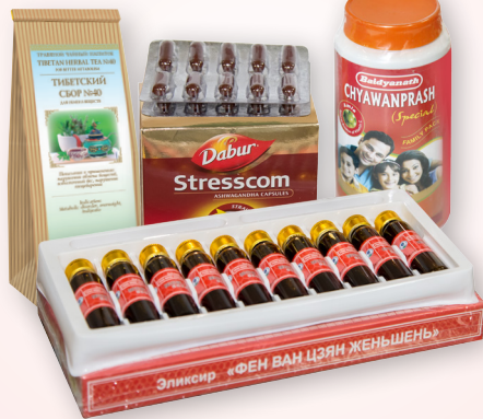
«Накопление энергии Ци»: Тибетский сбор №40, «Чьяванпраш», «Stresscom», эликсир «Маточное молочко»