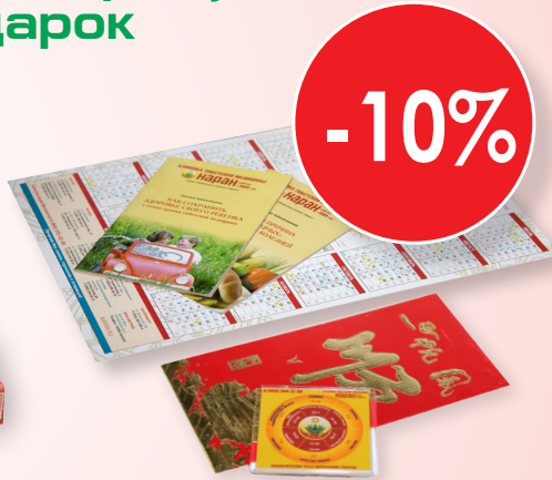
Фирменные сувениры: Лунный календарь, магнит, брошюра о питании (на выбор), конверт «Фэн-шуй»