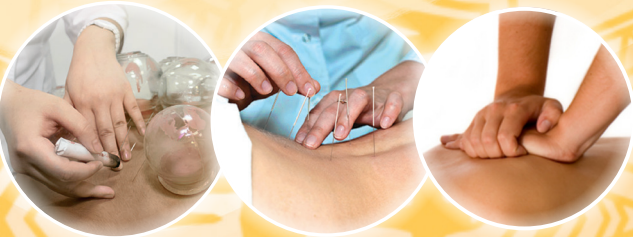
Методы лечения, проверенные временем