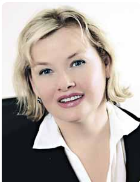
Тамара Васильевна Акулова

Наиболее известные роли: Маша в музыкальной комедии «Бедная Маша» (1981), леди Ровена в рыцарском киноромане «Баллада о доблестном рыцаре Айвенго» (1982), леди Гленарван в приключенческой ленте «В поисках капитана Гранта» (1985), Саша в социальной драме «Наследницы» (2001). Заслуженная артистка России.